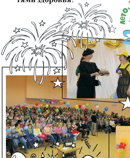
Вот таким был праздник в главной библиотеке города