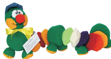
Детский сад №44