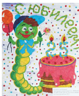
Детский сад №44