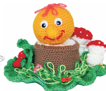
Детский сад №18