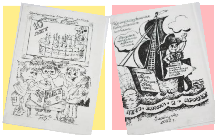
Буклеты на 10–летний юбилей летней программы