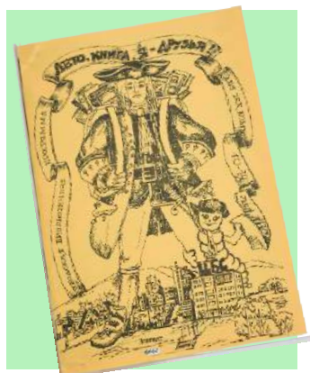
Буклет для ребят 10–14 лет по 6 номинациям